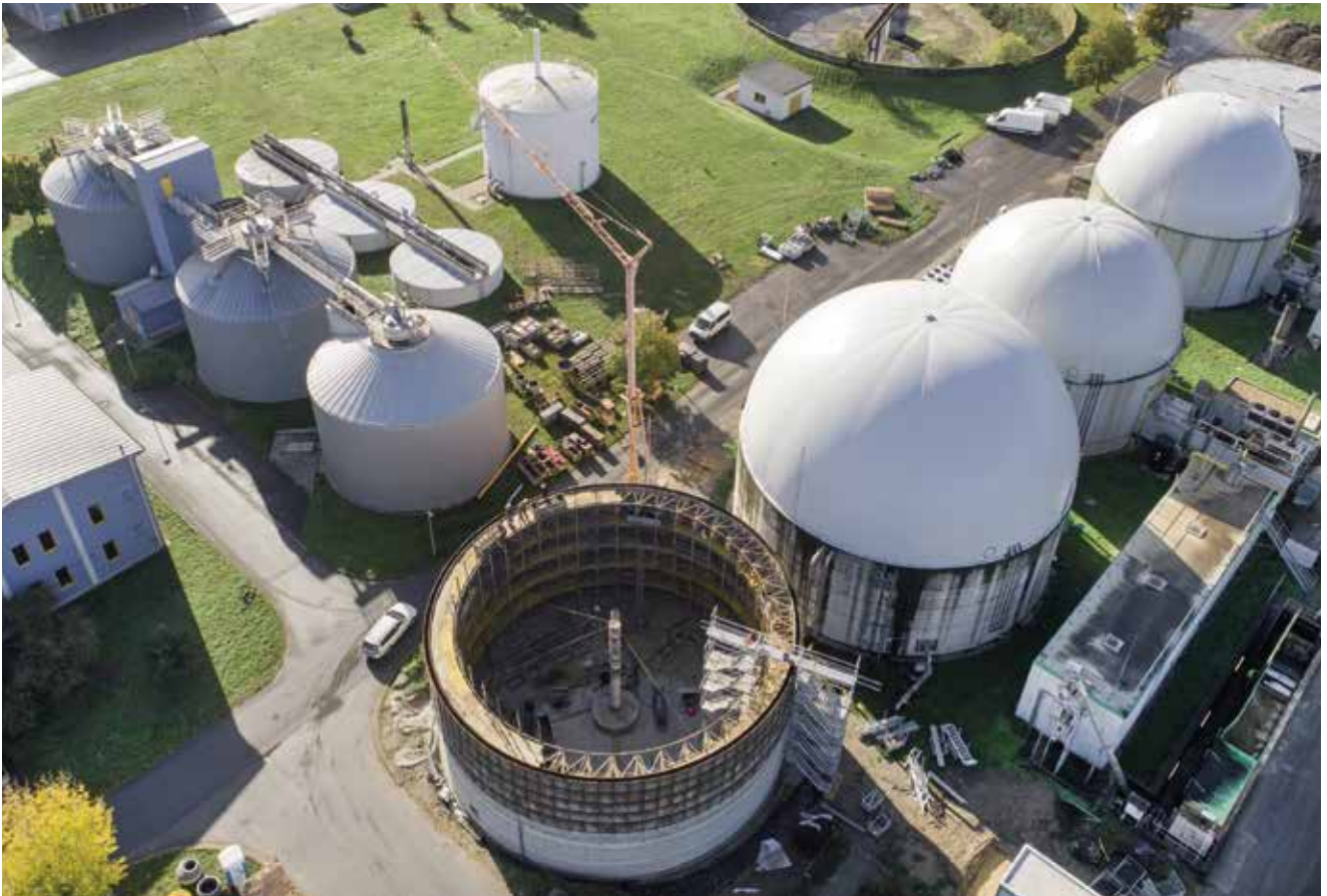
Durch Umrüstung fit für die Zukunft

▴ Ob Vertrag oder Regiebeauftragung – auf unseren Service können Sie bauen. ▽