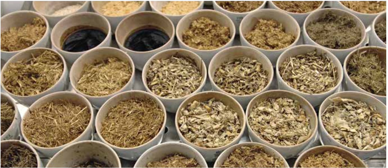
Bestimmung des Trockensubstanzgehalts von Substraten und Fermenterinhalt