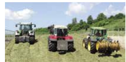
Verdichten der angelieferten nachwachsenden Rohstoffe